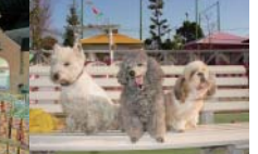
ふれあいコーナー